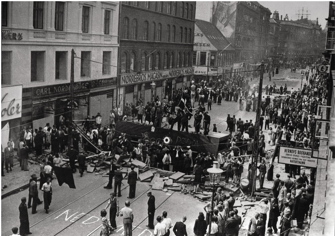
Vaga popular a Copenhaguen 1942.

El sabotatge i els aldarulls també poden influir quan impedeixen que l'ocupant tingui la calma que anhela. Significa que més personal i altres recursos estan invertits a mantenir l'ocupació i no es poden utilitzar per lliurar la guerra al front. Crec que ens cal discutir molt més aquests aspectes entre els estudiosos de la noviolència. Això requereix una avaluació oberta del paper del sabotatge i els disturbis, considerant tant com podrien donar suport a accions noviolentes, com quin podria ser el preu del sabotatge i els disturbis. Potser l'adopció de mètodes noviolents menys arriscats sense sabotatges ni disturbis pugui ser suficient per pertorbar la calma de l'ocupant i mantenir alt l'esperit de lluita. Ja he esmentat algunes opcions en relació amb Ucraïna, i això és una cosa que es podria estudiar més en casos històrics.