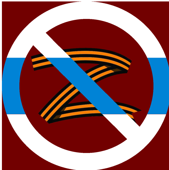
Un símbol de protesta contra la invasió d'Ucraïna per part de Putin.

Majken: Té raó, podria passar. No hi ha cap garantia de res. Només li dic el que mostren les investigacions i intento explicar la meua posició pacifista, que es deriva directament d'aquest coneixement. No obstant això, li podria fer la mateixa pregunta: com acabarà això? No ens enfrontem a dècades de guerra? Fins i tot si Ucraïna, amb el suport de l'OTAN, expulsés les forces russes d'Ucraïna, les tensions serien grans en el futur previsible. És probable que continuessin la guerra de baixa intensitat a les regions frontereres, com abans de la invasió a gran escala de Rússia. Quan se sentiran segurs els ucraïnesos? Crec que hem de pensar qui té més probabilitats de treure Putin del poder i canviar l'actitud de la població russa davant del que està passant a Ucraïna. En aquest moment, les forces autoritàries a Rússia s'estan enfortint, i com més duri la guerra, més hostilitat hi haurà entre Rússia i Ucraïna les properes dècades.