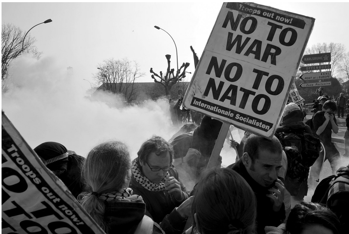
Protesta contra l'OTAN a Estrasburg.

Majken: Absolutament. Estem completament d'acord que aquest acte d'agressió brutal va ser iniciat per Rússia, en violació del dret internacional. Però això no exclou que el govern rus se sentís amenaçat i provocat per dècades d'expansió de l'OTAN, que ara estava just a les portes de Rússia, amb Ucraïna desitjant unir-se a l'OTAN. Si hom vol comprendre la situació i trobar maneres de reduir la violència, cal reconèixer com perceben els altres la situació, encara que les seves reaccions li semblen irracionals o paranoïques.