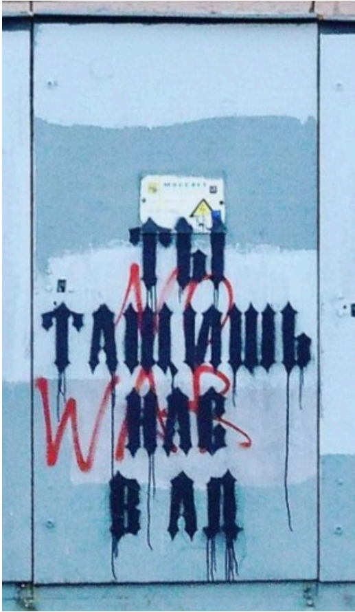
Graffiti a Moscou d'un artista anomenat Zoom diu: "Ho ets arrossegant-nos a l'infern".

descomptat, seria més fàcil per als russos fer aquesta feina si la lluita a Ucraïna es lliurés amb mitjans no violents. Com ja hem comentat quan es tracta de no violència, és una qüestió d'estratègia a llarg termini, comprendre quin tipus de joc de poder està en marxa i adonar-se de qui està disposat a escoltar qui.