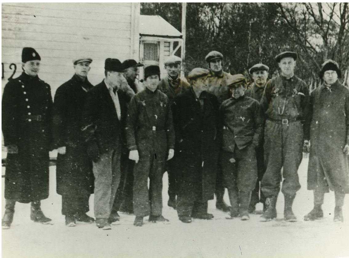
Professors al camp de presoners de Kirkenes, Noruega, 1942.

l'exercici del poder sempre depèn de la cooperació, i com aquesta idea és crucial per comprendre la dinàmica de l'acció no violenta 9 .