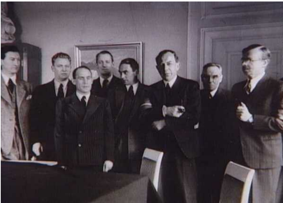
Membres del Consell Danès per a la Llibertat després de l'ocupació.