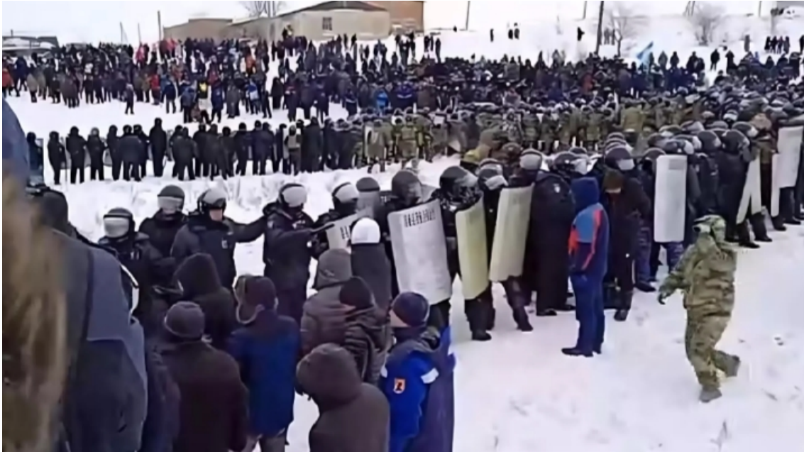
Manifestants i policia a Baymak, Rússia. Gener 2024.

Majken: Em sorprendria que no consideressin la possibilitat. Però aquí hem de recordar que un ocupant vol calma i una aparença de tenir-ne el control. Si haguessin matat els 645, haurien causat un gran enrenou. Enviar-los a tots a camps hauria deixat les esglésies gairebé sense capellans, i això seria l'oposat a la normalitat. A més, qui hauria pogut ocupar els seus llocs amb una mica de legitimitat? No hi havia altres 645 sacerdots noruecs educats i amics dels nazis tot esperant fent cua. A més, la situació amb els professors es va desenvolupar paral·lelament, cosa que probablement va causar tanta preocupació que els nazis no van voler agreujar la situació amb l'Església.